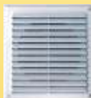
Cozinha, Divisória e Painel