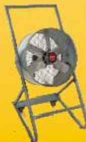
Ventex Ventilador Axial c/ suporte móvel