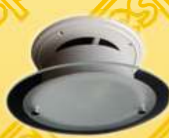
c/ LUMINÁRIA (BL)

A falta de uma exaustão ou ventilação adequada num ambiente é a fonte de problemas de odores, mofos e umidade.